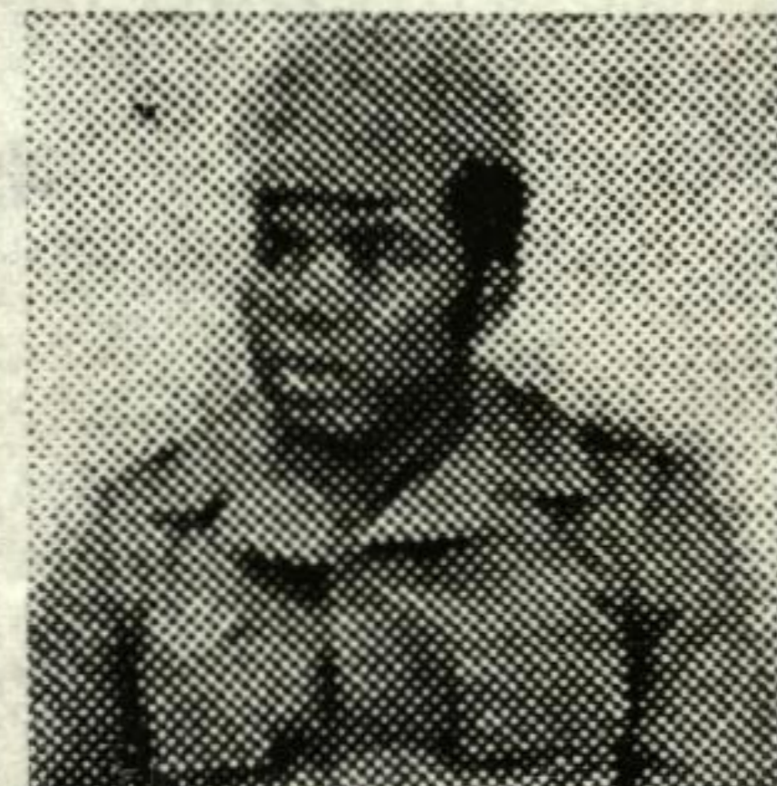
PRESIDENT Marien NGOUABI

Jeunes ! Immortalisons notre guide dans et par le travail, la rigueur et la discipline révolutionnaires